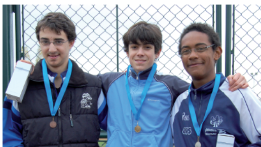
Il podio Allievi

Venerdì 14 novembre, presso il Villaggio "Francesco Bongioanni" di Fossano, si è svolta la fase locale della corsa campestre rivolta agli Istituti Superiori. Quattro le categorie presenti: Juniores femminile e maschile, allieve e allievi.