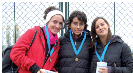
Il podio Allieve