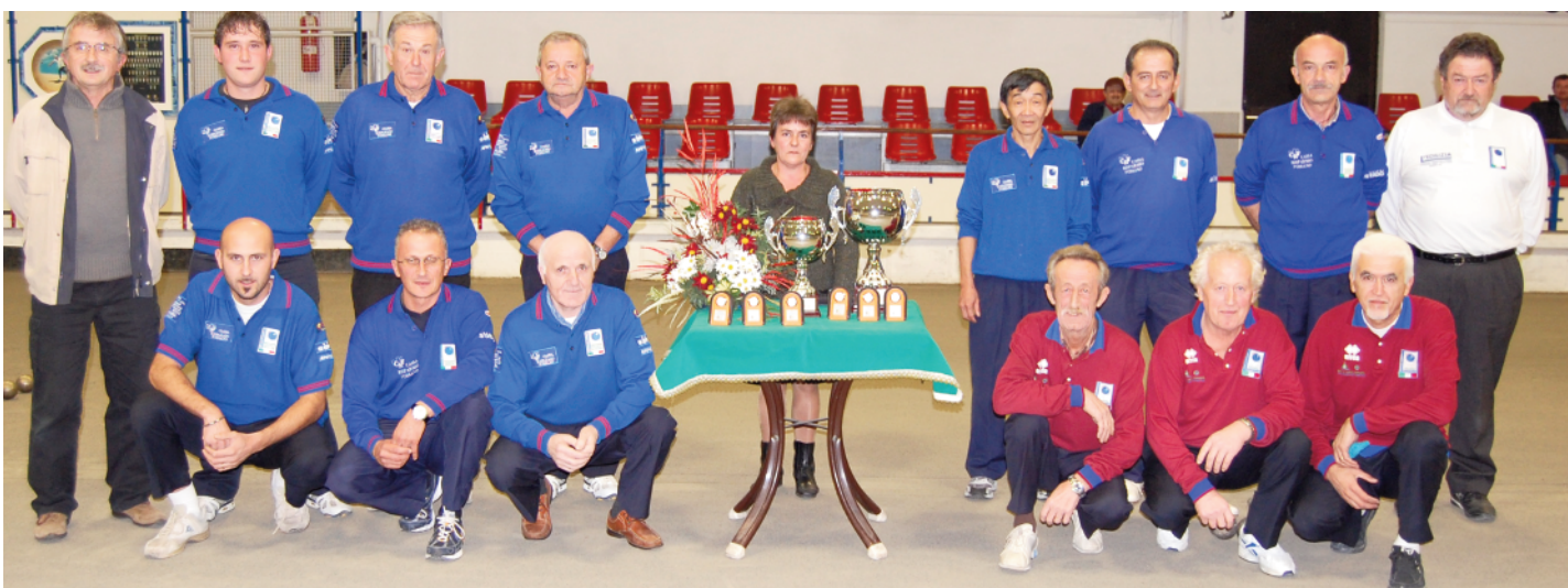
I protagonisti del Memorial Roasio con la moglie, l'arbitro e il presidente della bocciofila