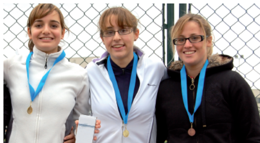
Il podio Juniores femminile