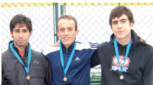
Il podio Juniores maschile