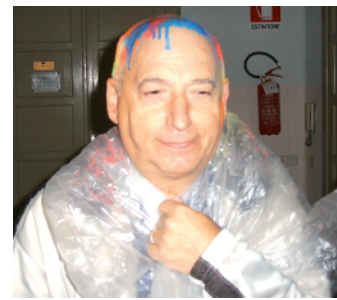
... e dopo