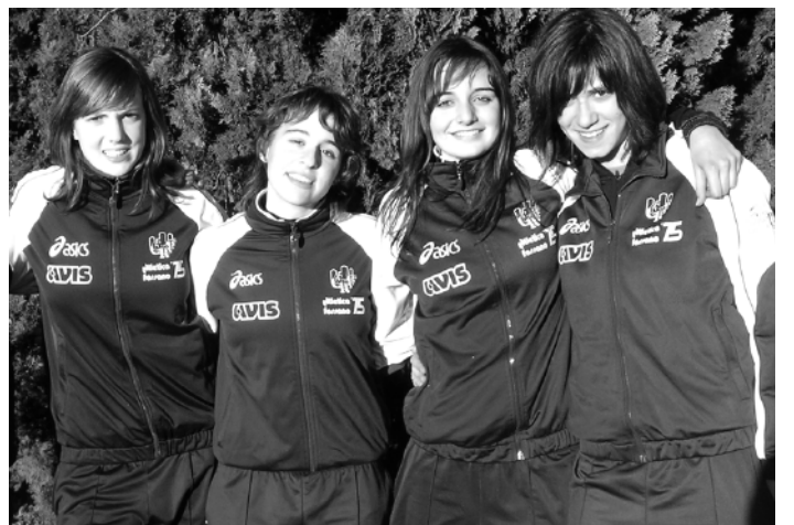
La squadra campionessa regionale