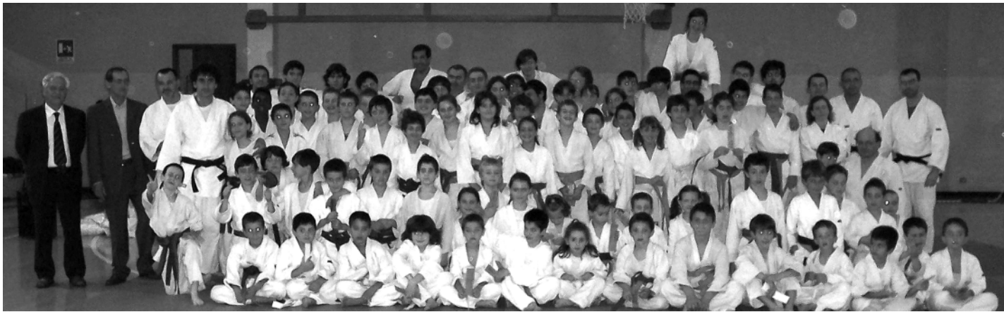
Lo staff dello Judo Fossano

Il 16 maggio l'Associazione Sportiva Judo Fossano ha coronato l'anno sportivo 2007-2008 con l'esame per il passaggio di cintura dei suoi oltre 100 atleti. La serata è un momento atteso da grandi e piccini che approfittano di questo appuntamento per dimostrare ai propri famigliari ed amici, che sono sempre numerosissimi, ciò che hanno imparato con fatica ed impegno. Questa serata risulta sempre di grande impatto visivo, ma soprattutto emozionale per il pubblico che assiste. Mentre per l'istruttore e i suoi numerosi collaboratori è una grandissima soddisfazione