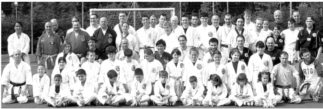
Lo staff trinitese