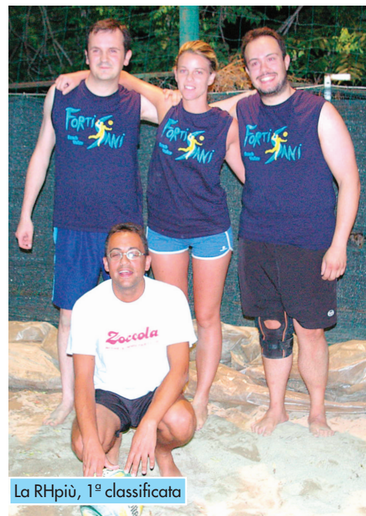
La RHpiù, 1ª classificata