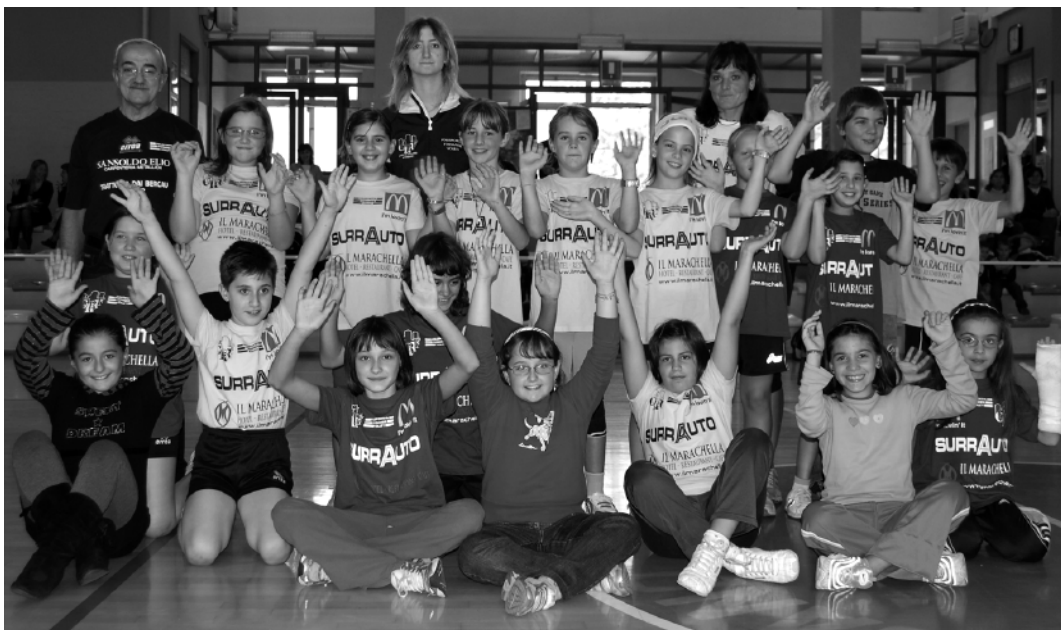
Il Mini Volley