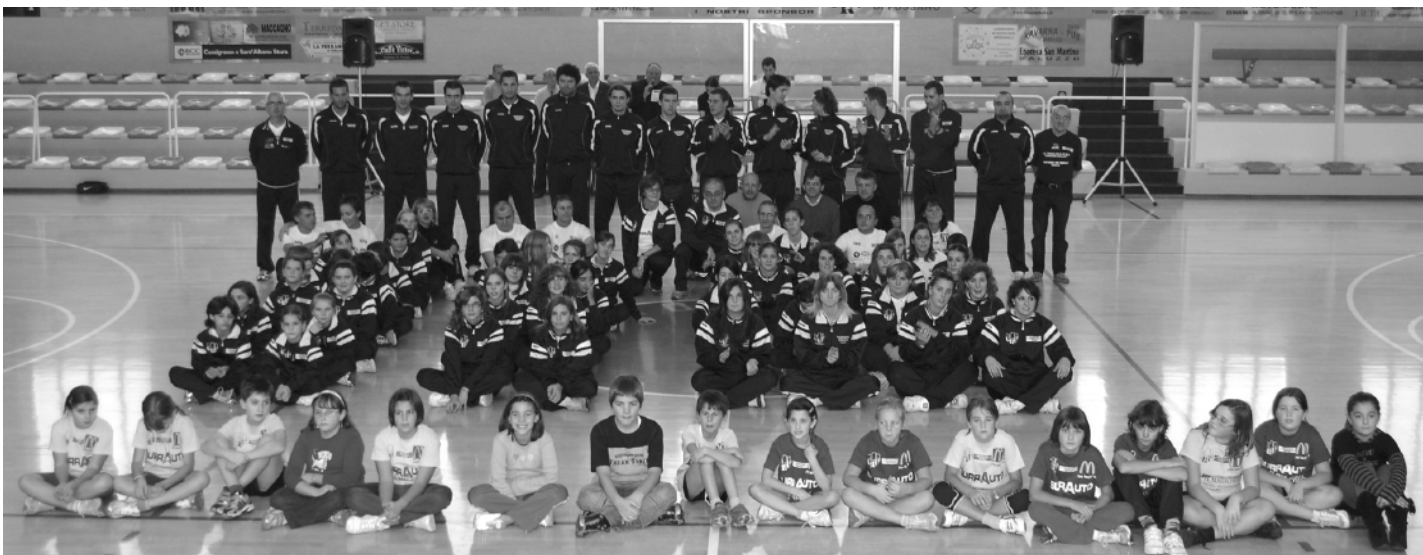
Foto ricordo con tutte le squadre della Polisportiva Fossanese