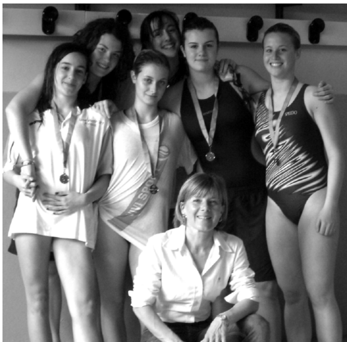
Le Cadette della Scuola Media Unificata di Fossano