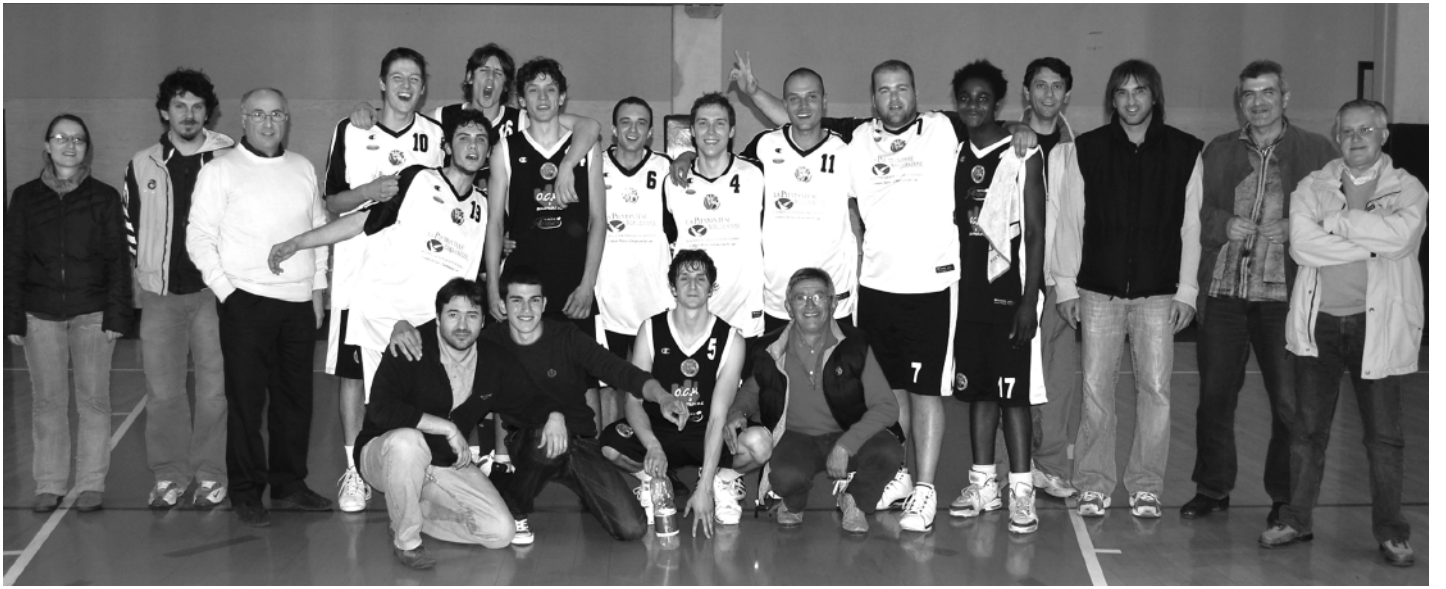
La Naxia Virtus Fossano felice dopo la conquista della salvezza

Cigliano, In Progress p. 2, Biella, Alessandria, Virtus Fossano p. 0.