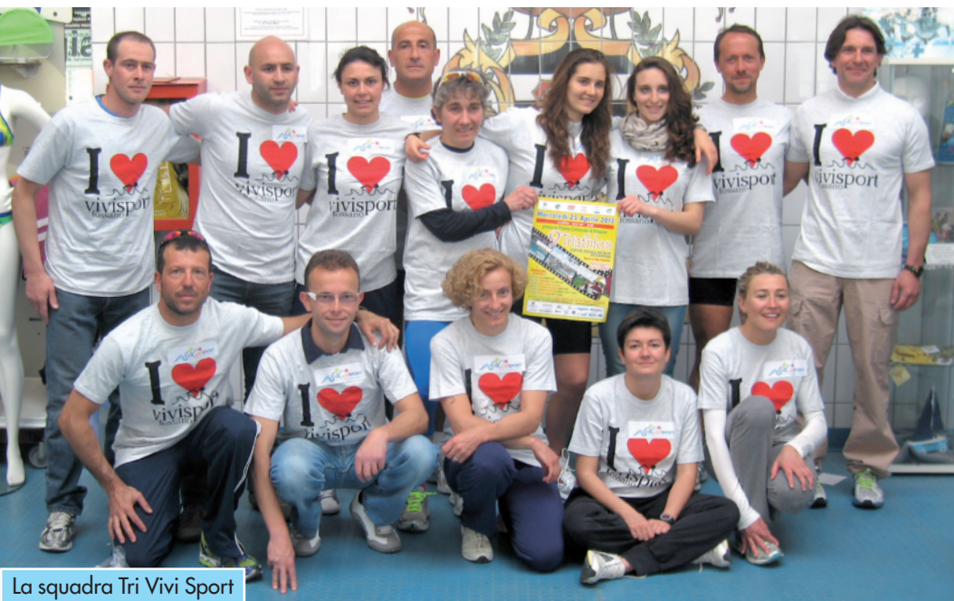
La squadra Tri Vivi Sport

Ben 235 concorrenti (tra cui 35 esordienti) hanno partecipato al 9° Triathlon Città degli Acaja di Fossano affrontando i 750 metri di nuoto, i 22 km di ciclismo e i 5 km di podismo finali, applauditi dal primo all'ultimo metro da un pubblico delle grandi occasioni.