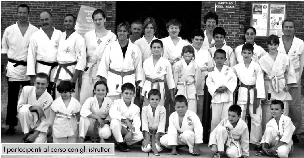
I partecipanti al corso con gli istruttori

A coronamento del corso 2008-2009, sabato 6 giugno, dalle 18,30 alle 19,30, nella splendida cornice del castello degli Acaja di Fossano, si è tenuta una dimostrazione di Arti marziali del Cadp (Club autonomo difesa personale) Jiu - Jiutsu Fossano. Dopo un anno di serio impegno, forte entusiasmo e disciplina, sui ta-