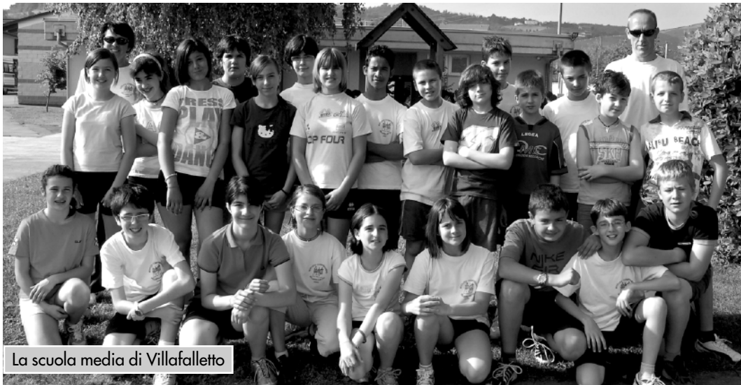
La scuola media di Villafalletto

Giovedì 28 maggio le scuole medie di Cavallermaggiore, Costigliole Saluzzo, Manta, Revellino, Saluzzo, Verzuolo e Villafalletto hanno partecipato all'8ª edizione del Memorial "Paolo Demarchi", manifestazione sportiva valida come fase zonale di atletica leggera e rivolta ai ragazzi/e della 1ª media. Alla competizione hanno preso parte circa 200 ragazzi/e che si sono cimentati nelle varie specialità. Al termine dell'intensa giornata di gare, sono tre le scuole che, grazie agli ottimi risultati, si sono aggiudicate la qualificazione alla fase provin-